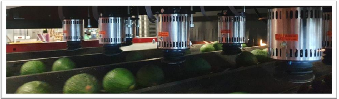
Calibreuse par maturité avocat

Spécialiste du mûrissage des bananes et des exotiques (mangues, avocats), Omer-Decugis & Cie a depuis de nombreuses années engagé des investissements pour augmenter ses capacités productives et se doter des meilleures technologies existantes sur le marché.