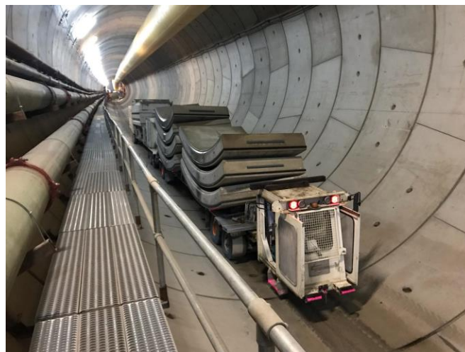
Le TSP 70 tonnes transportant des voussoirs