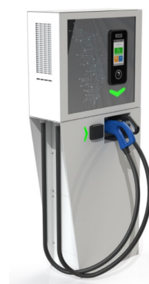
La Tiny permet de recharger l'ensemble des véhicules électriques du marché.

Ce nouveau succès commercial confirme l'adéquation de la nouvelle borne Tiny 25 à la demande des marchés publics comme privés, avec des installations qui se poursuivent dans des enseignes comme Burger King, les centres commerciaux Leclerc ou des concessions BMW. Cette dynamique s'appuie également sur les efforts de la nouvelle équipe commerciale renforcée.