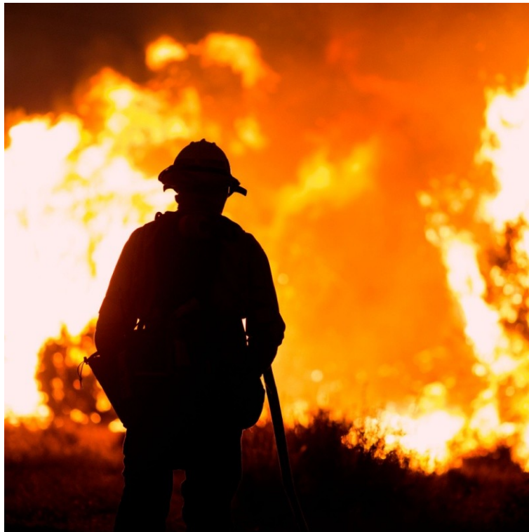
Wildfires in Greater Los Angeles