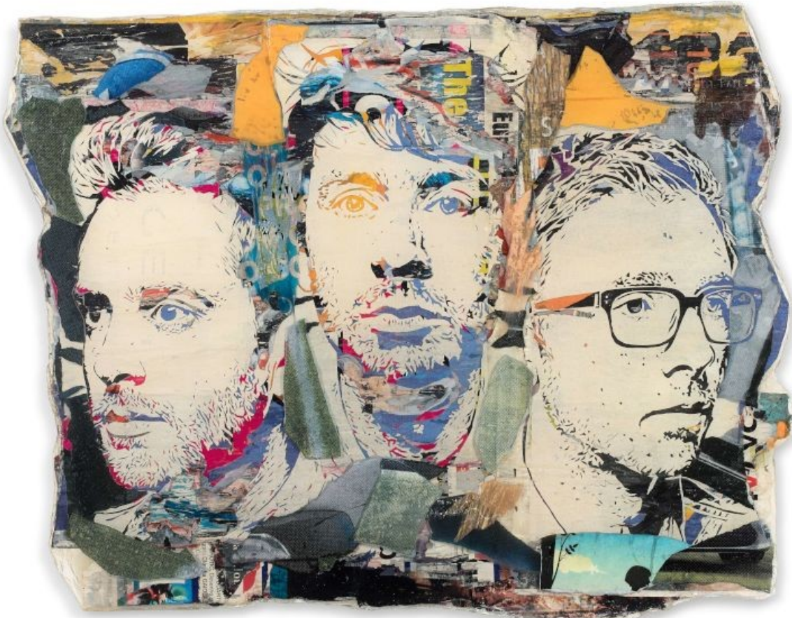
Image : https://imgpublic.artprice.com/img/wp/sites/11/2022/03/image1-Vhils-Delphic.jpg

Vhils, Delphic (2012). Affiche lacérée, arrachage, résine époxy. Vendue 39 300 $ le 5 mai 2019 ©Artcurial