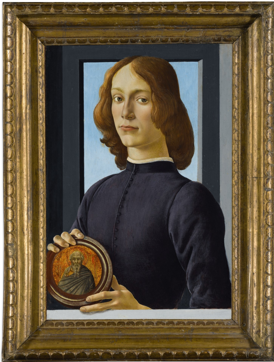
Botticelli, Portrait of a young man holding a roundel , $92,184,000 at Sotheby's New York, January 28, 2021

[https://imgpublic.artprice.com/img/wp/sites/11/2021/12/image2-boticelli.jpeg]