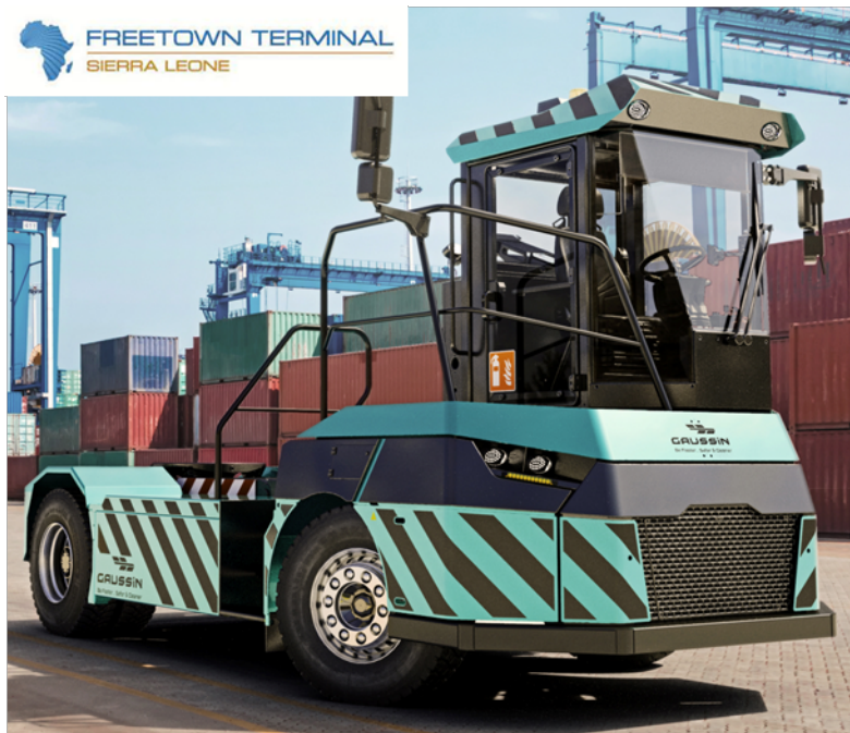
APM® 75T HE 100% électrique