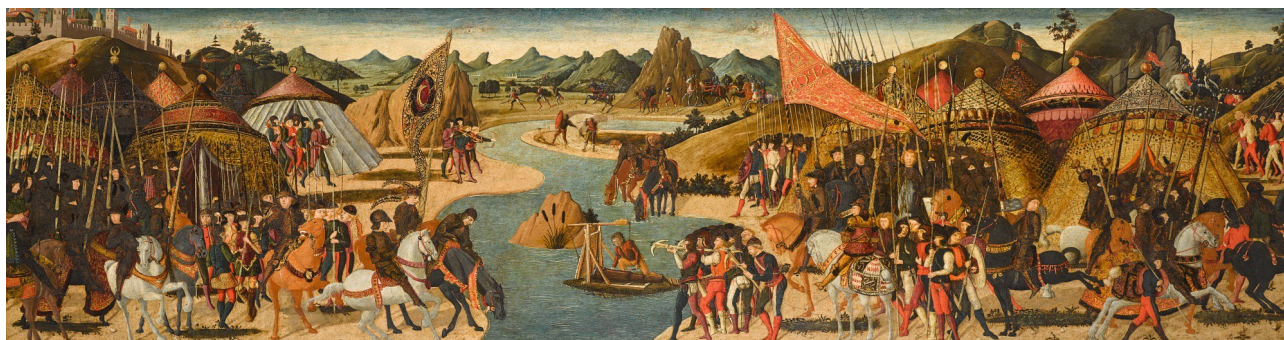
Paolo UCCELLO (1397-1475) - Battle on the banks of a river, probably the battle of the metaurus (207 BCE)

Grâce aux ventes en ligne, les Maisons de Ventes ont trouvé le moyen de traverser la crise sanitaire en poursuivant leurs activités. Le confinement les a forcées à opérer la dématérialisation soudaine et complète de leurs catalogues et de leurs plus belles sessions. Cette évolution, longtemps attendue sur le Marché de l'Art, a permis d'assurer l'essentiel des échanges et de préserver la confiance des vendeurs. Plusieurs performances tout à fait remarquables ont même pu être enregistrées.