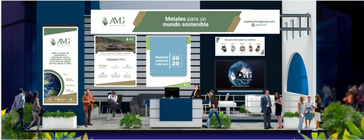
Stand virtuel d'AMG lors du « Congreso de competitividad Minera y Sostenibilidad Social »

AMG a participé au « Congreso de Competitividad Minera y Sostenibilidad Social » (CCMYSS), un événement organisé par l'Institut péruvien des ingénieurs miniers (IIMP) qui s'est tenu du 12 au 16 octobre 2020. Le forum virtuel a réuni les principaux acteurs du secteur miniers péruviens (publics et privés) afin de définir la contribution que l'exploitation minière doit apporter aux programmes de sauvegarde des communautés.