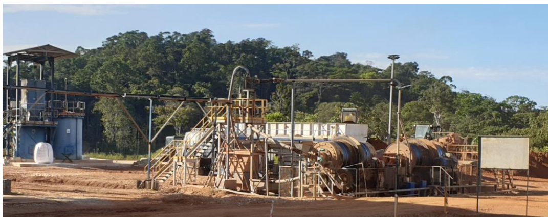
Le 1 er des deux broyeurs complémentaires est en place

Le tonnage traité à ce jour atteint 2 000 tonnes pour une teneur moyenne de 4,76 grammes d'or par tonne.