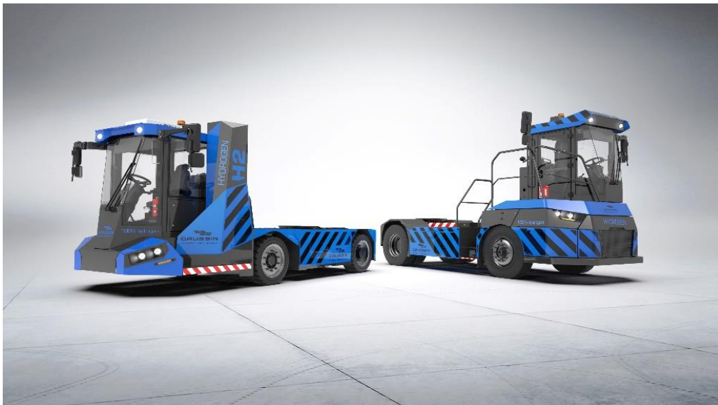
L'ATM-H2 et l'APM-H2, nouveaux fers de lance de la gamme de véhicules GAUSSIN

Enfin, cette technologie ouvre la voie à d'autres innovations pour l'avenir. L'hydrogène est non seulement un acteur majeur pour l'avenir du transport de charges lourdes mais aussi un vecteur énergétique important dans l'avènement des énergies solaires et éoliennes. Avec l'hydrogène, il devrait être possible de lisser la production de ces énergies propres et de mieux les intégrer aux réseaux de distribution électrique.