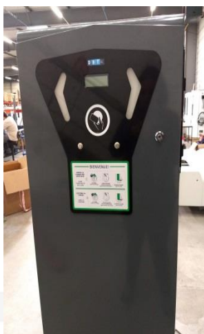
La borne Keren

Commercialisée en 2018, la Keren est destinée à l'espace public.