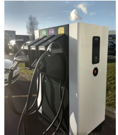
Le chargeur rapide Compact 50

Remplaçant du chargeur rapide le plus installé en Europe, le Compact 50 charge les 3 standards de charge rapide actuels. Pour assurer une compatibilité avec les futurs VE, la gamme est basée sur les standards internationaux les plus stricts. La modularité de la conception 100% française assure une évolutivité future et un maintien de service en cas de panne d'un des modules du chargeur. 100% connecté la borne autorise les mises à jour et actions à distance, ce qui apporte une réactivité en temps réel pour les opérateurs de mobilité et garanti une disponibilité optimale.