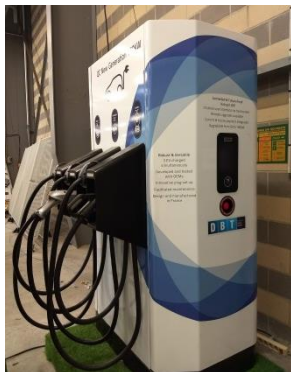
Chargeur rapide Ultra 150

Stand 234 E-Racing-Car Pavillon 1 Allée B