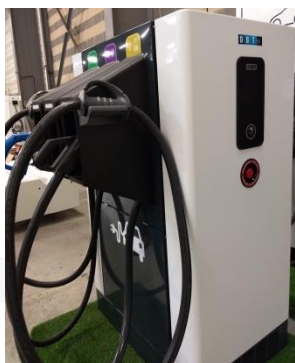
Chargeur rapide Ultra 50