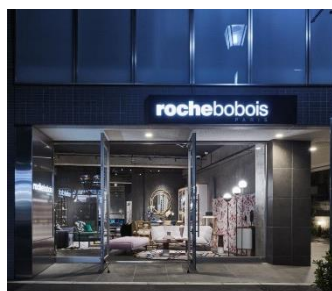
JUIN 2018 Tokyo (Japon) - 2 ème magasin