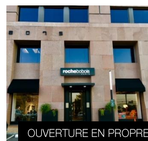
JUILLET 2018 Tysons Corner (USA)