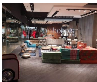
JUIN 2018 Kiev (Ukraine) - 2 ème magasin