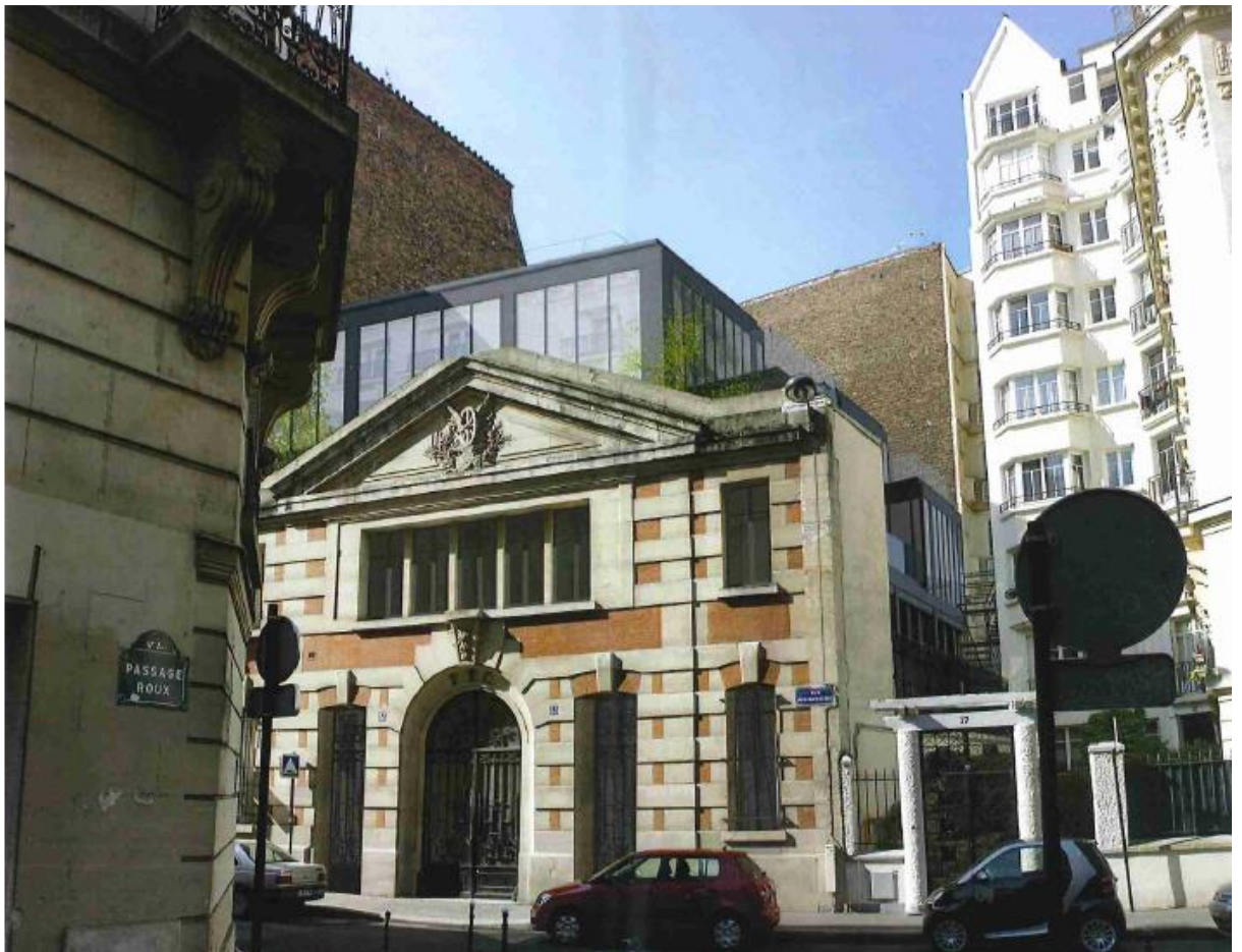
Vue d'architecte du 35 rue Renaudes après travaux (DGM & Associés)

Outre sa localisation, dans un quartier d'affaires recherché, le site dispose d'un potentiel de création de valeur grâce à sa capacité d'extension. En effet, un permis de construire a été obtenu en vue de la surélévation d'un étage afin de porter la surface totale à plus de 1 000 m 2 .