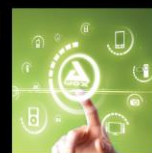
SMART HOME TECHNOLOGIES