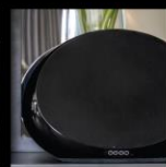
HIGH-FIDELITY AUDIO STREAMING