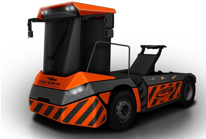
L'APM 75t - Autonomous Prime Mover

GAUSSIN et DIGIROBOTICS avaient déjà présenté au salon TOC Amsterdam en juin 2017 la gamme APM « Autonomous Prime Mover ». L'APM, nouveau tracteur communément appelé Prime Mover dans le secteur portuaire, est le premier tracteur GAUSSIN à bénéficier d'un kit de conversion TRUGO, développé par DIDRIVER. TRUGO permet de robotiser le véhicule lourd en conduite autonome, c'est-à-dire avec ou sans chauffeur, en mode automatique en utilisant la « navigation naturelle » qui permet de s'affranchir des équipements et infrastructures traditionnels.