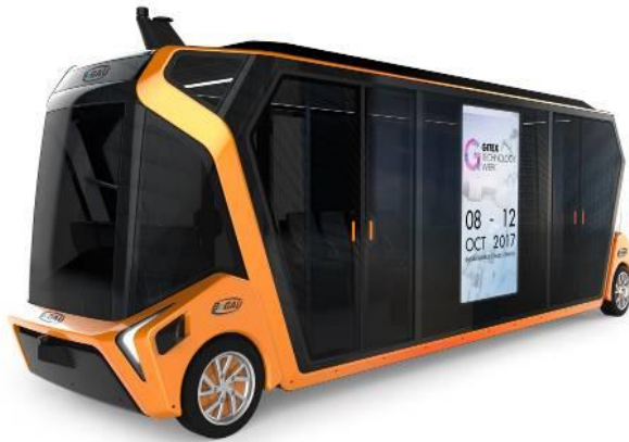
BeGAU 24 passagers FULL ELECFULL ELEC

La 1 ère version de BeGAU a été présentée au salon GITEX qui s'est tenu à Dubaï du 8 au 12 octobre 2017 et sera présenté au salon CES 2018 à Las Vegas en janvier 2018. Les 1 ers essais de BeGAU en conditions réelles auront lieu à Dubaï au cours du 2 ème semestre 2018. Les véhicules seront fabriqués par la société Gaussin à Héricourt et les deux partenaires participeront conjointement aux différents appels d'offre à travers le monde.