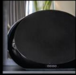
HIGH-FIDELITY AUDIO STREAMING