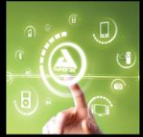
SMART HOME TECHNOLOGIES