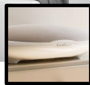
HIGH-FIDELITY AUDIO STREAMING