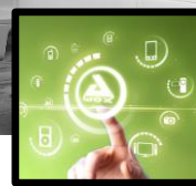
SMART HOME TECHNOLOGIES