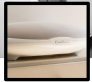
HIGH-FIDELITY AUDIO STREAMING