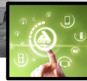
SMART HOME TECHNOLOGIES