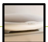
HIGH-FIDELITY AUDIO STREAMING