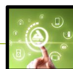
SMART HOME TECHNOLOGIES