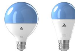
Ampoules Bluetooth Mesh