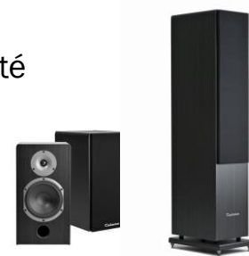
Haut-parleurs coaxiaux dans les enceintes Jersey et Antigua