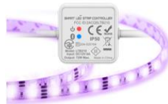
GAMME Smartled STRIP