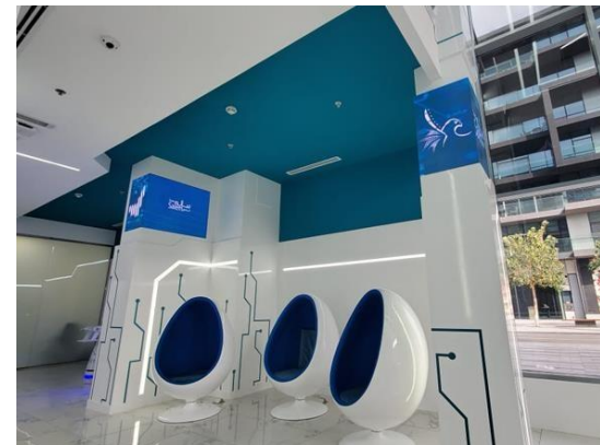
La salle d'attente Smart Salem