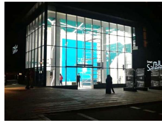
Le centre médical Smart Salem