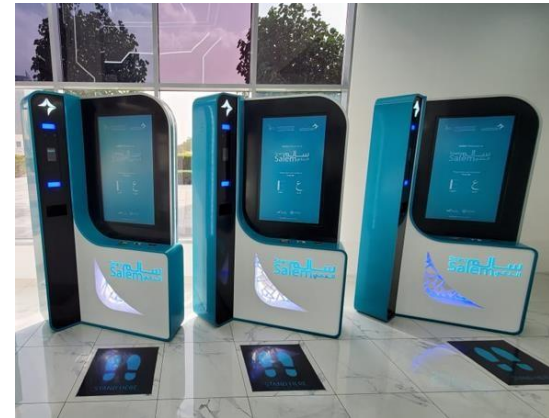
Les Smart Kiosks Smart Salem